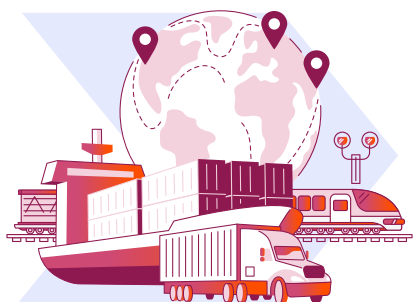
Prevoznici koji rade na morskim i kopnenim vodenim putevima, putevima i železnici