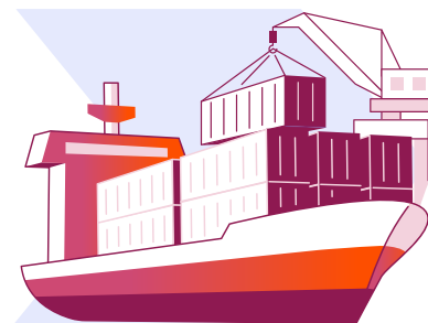
Konačni primalac isporuke (morski transport)